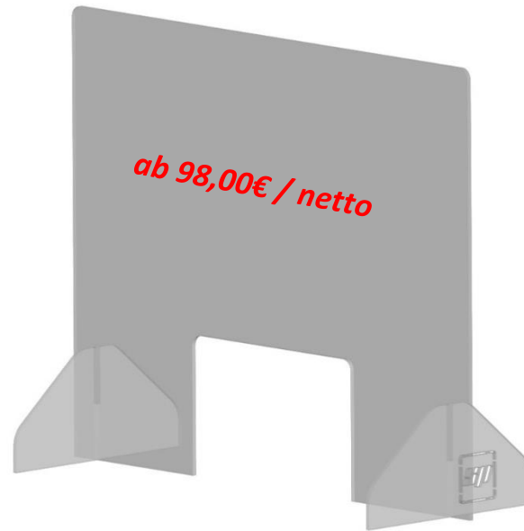
Wand Öffnung groß